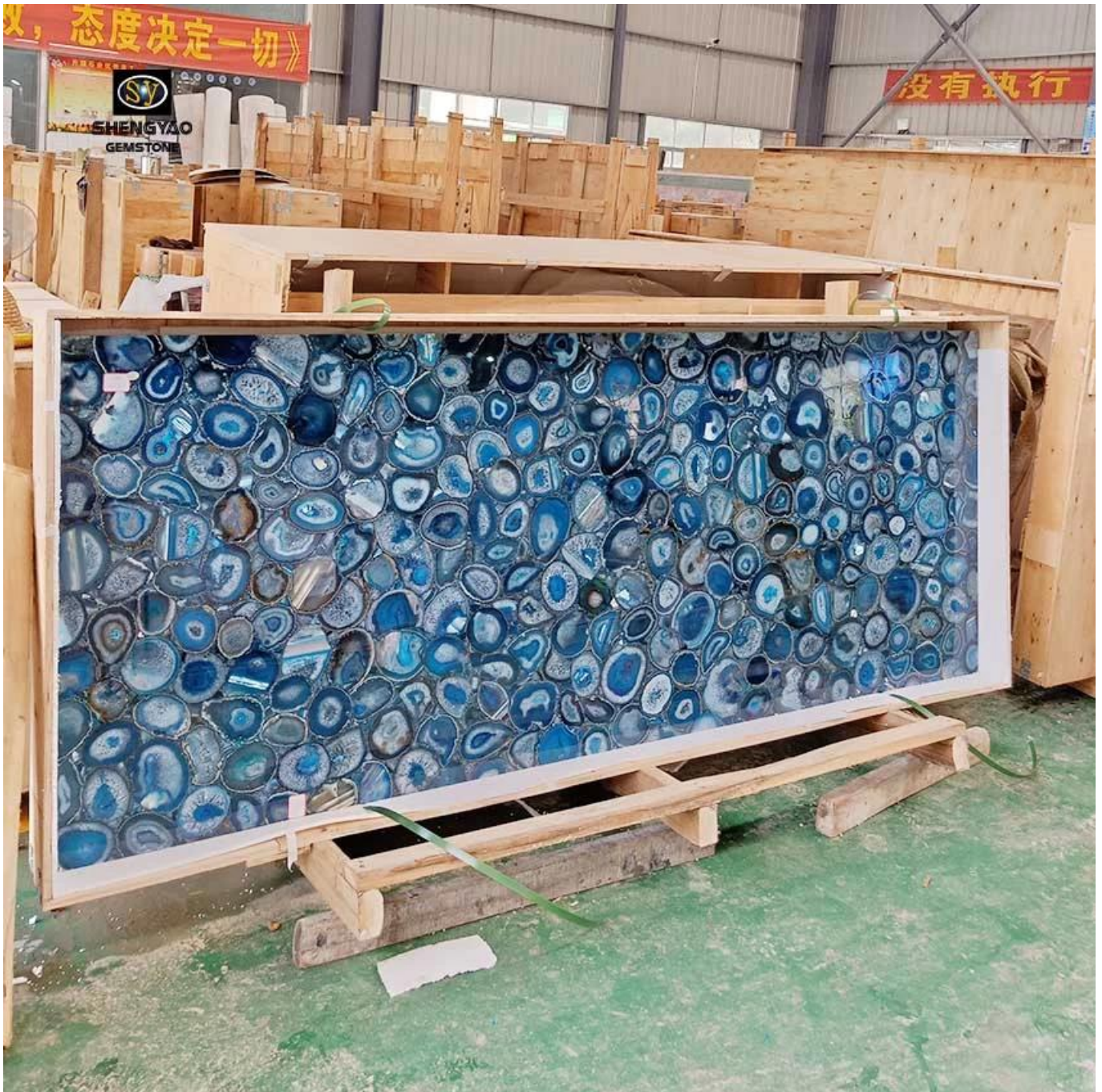
(Blaue Achat Edelsteinplatte)

Achat ist polykristallin, mit glas- und öglänzender Oberfläche, natürlicher Textur und glatter, Farbverlaufsfarbe bringt starkes Sense-Level, verschiedene Bands, während Achat einer der sieben Schätze des Buddhismus ist, da die alten Zeiten als Talisman, Amulett, ein Symbol von Freundliche Liebe und Hoffnung, Hilfe, um Stress, Müdigkeit, Abwasser und andere negative Energie zu beseitigen, die Flexibilität, die dem Wirtschaftswachstum, starken finanziellen Ressourcen helfen wird. (Herkunft: Brasilien, Uruguay, Indien, Argentinien) (Hintergrundbeleuchtung)