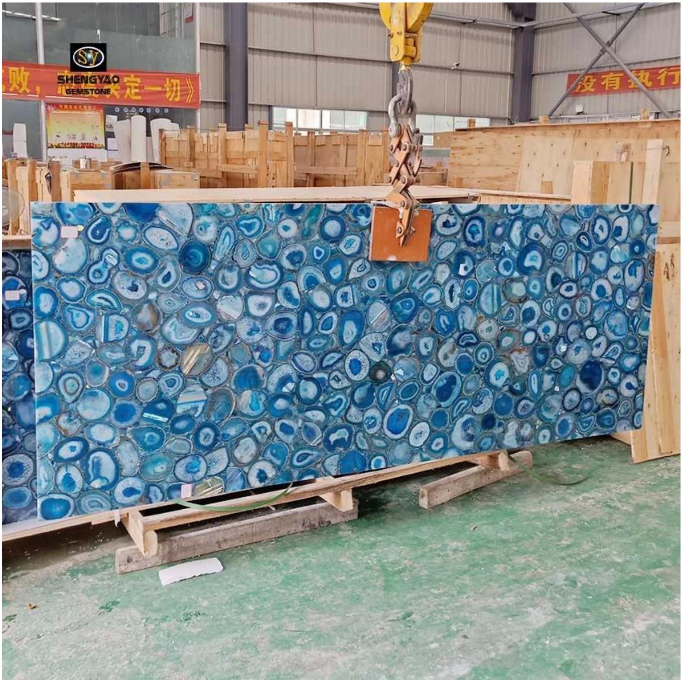
(Blaue Achat Edelsteinplatte)