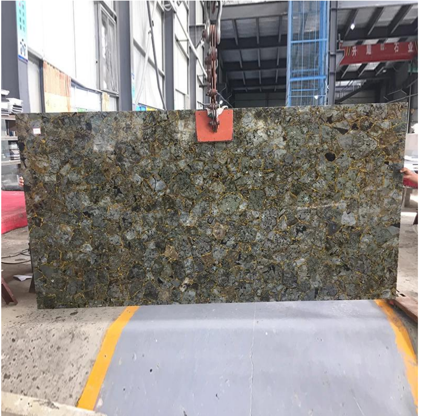
(Luxus labradorit mit Goldfolie Edelsteinplatte)