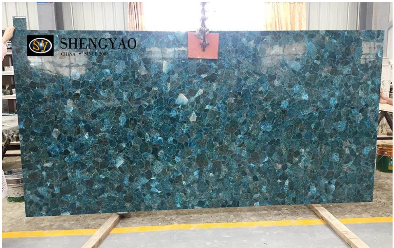
pulido fabricante de losas de piedras preciosas de China

Losa de piedra semipreciosa de apatita es una nueva losa de decoración de piedras preciosas, con un cian único, entre azul y verde. Se utiliza principalmente en la pared de fondo, el piso, los muebles y otras decoraciones de arriba.