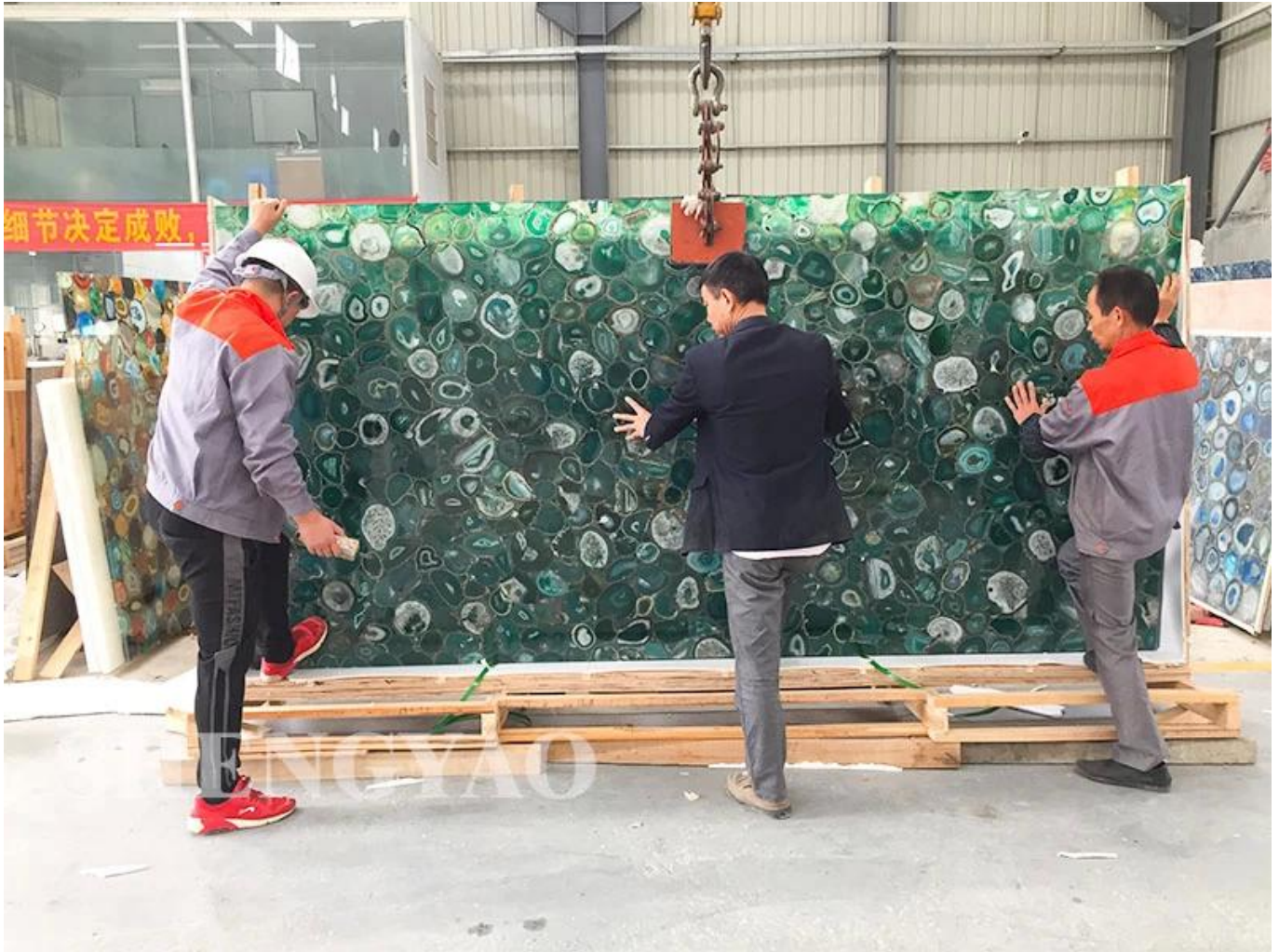
□Embalaje de losa de ágata verde□

Shengyao Gemstone es un fabricante y proveedor líder de losas de piedra semipreciosa en China. Somos una fábrica de losas de piedras preciosas de calidad y .