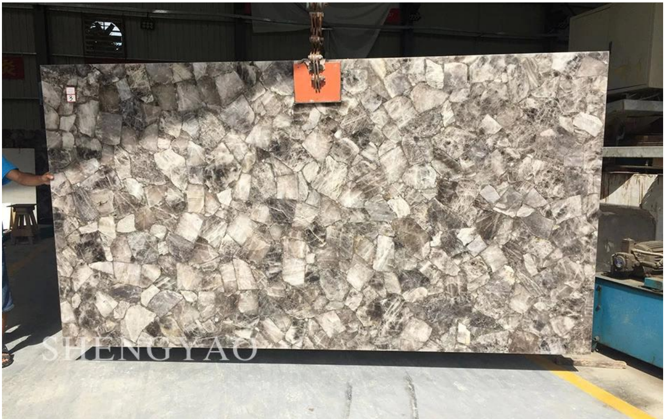
□Losa de cristal ahumado□

El cristal de humo (también conocido como cuarzo ahumado, citrino o cristal de té) es una clase de color que es gris humo amarillo humo, marrón, variedades de cristal marrón, el color etéreo difuminado, belleza, es uno de los miembros más atractivos de la familia del cristal. los Alpes cubiertos de nieve, lleva los tesoros más prístinos del mundo, en 2178 metros en la roca circundante, y enterrado una piedra preciosa de colores fascinantes: cuarzo ahumado (origen: Sudáfrica, Brasil) (retroiluminado)