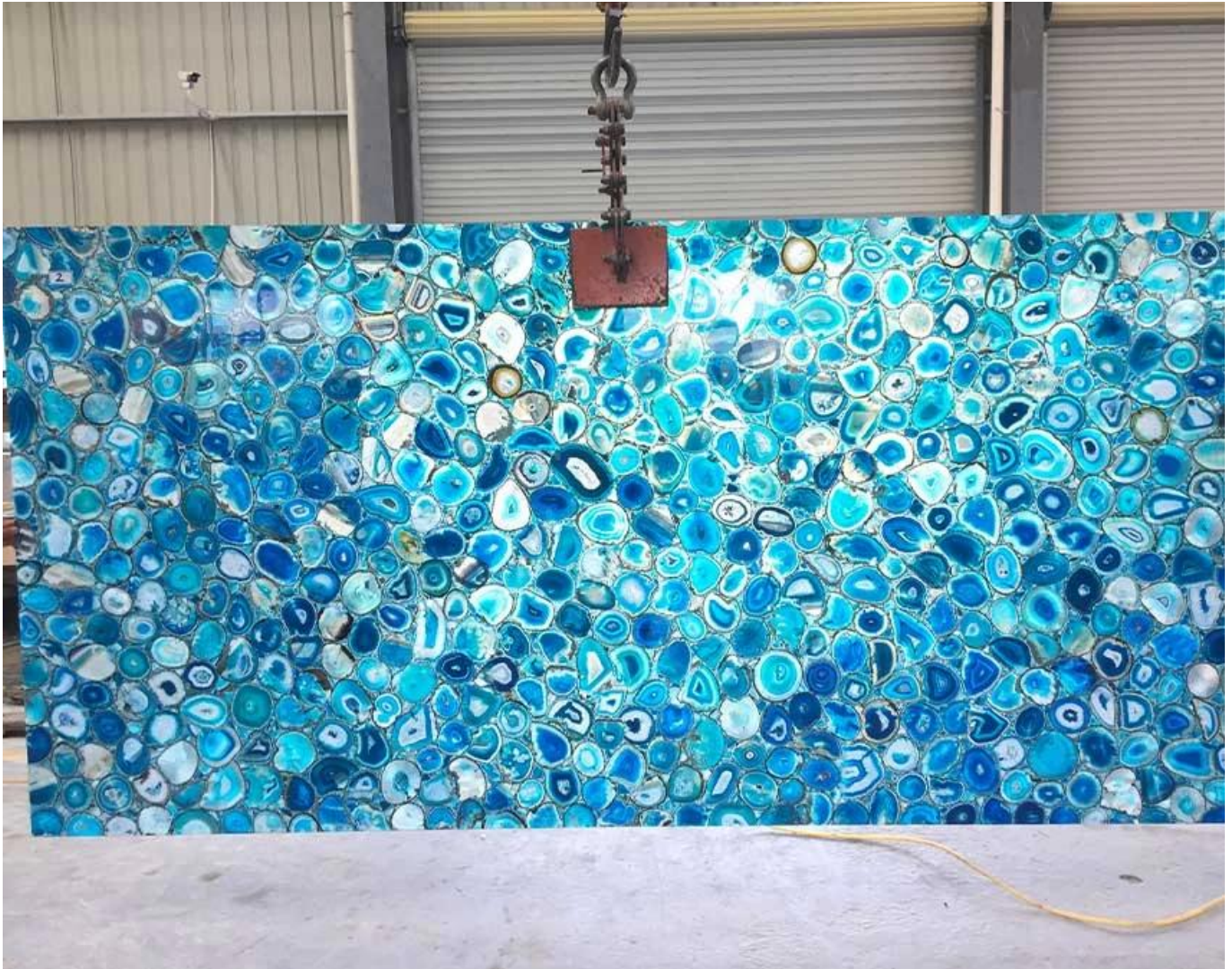
(Dalle d'agate d'agate bleue)