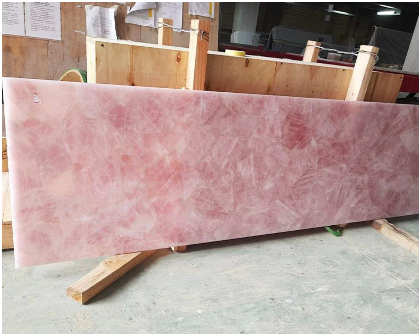
(Dalle de quartz rose)

célèbre pour son symbole d'amour. Texture fragile du quartz de rose, qui contient un élément de titane en raison de la formation d'une trace de quartz pure, pure quartz permet une plage de longueurs d'onde d'ultraviolet, visible et peut rendre les rayons infrarouges, avec des propriétés optiquement actives et piézoélectriques et électrostrictives. Peut être semi-mortes, transparents et translucides, mais des cristaux naturels très clairs et lumineux, nous appelons IT Star Rose Quartz. (Origine: Brésil, Madagascar) (Backlit)