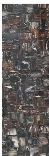
Black Petrified Wood Slab Applied To The Wall