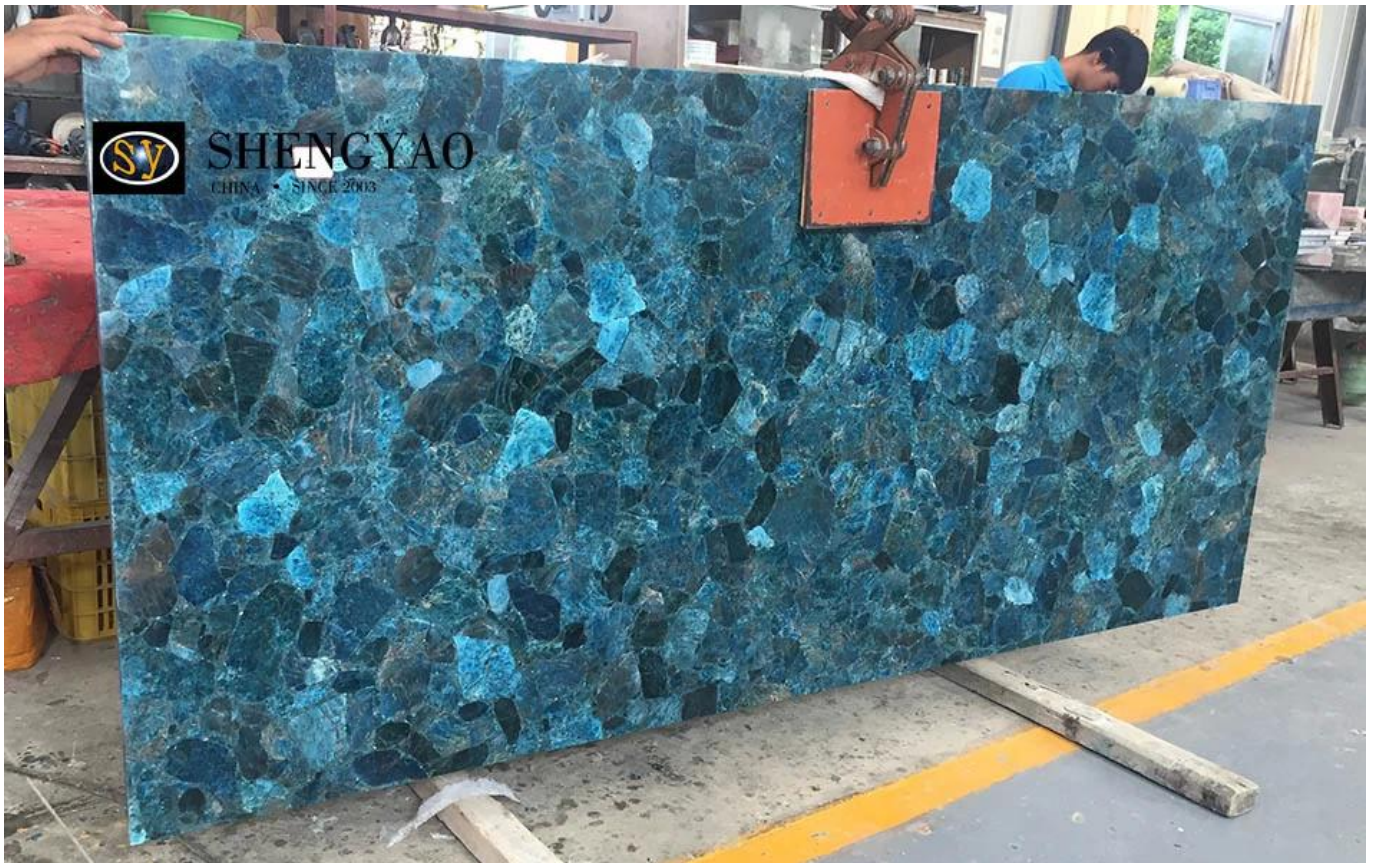
iofornitore di lastre di pietre semipreziose blu Cinaio

L'apatite si riferisce al minerale di fosfato nella roccia ignea e nella roccia metamorfica sotto forma di apatite cristallina. Un gruppo di minerali di fosfato contenenti calcio. L'apatite ha la forma di cristalli vitrei, blocchi o noduli, con vari colori, per lo più colonne esagonali con superfici coniche. I grandi depositi di apatite sono principalmente rocce sedimentarie marine poco profonde, principalmente collofanite. Come Xiangyang in Hubei, Kunyang in Yunnan e Kaiyang in Guizhou. (retroilluminato)