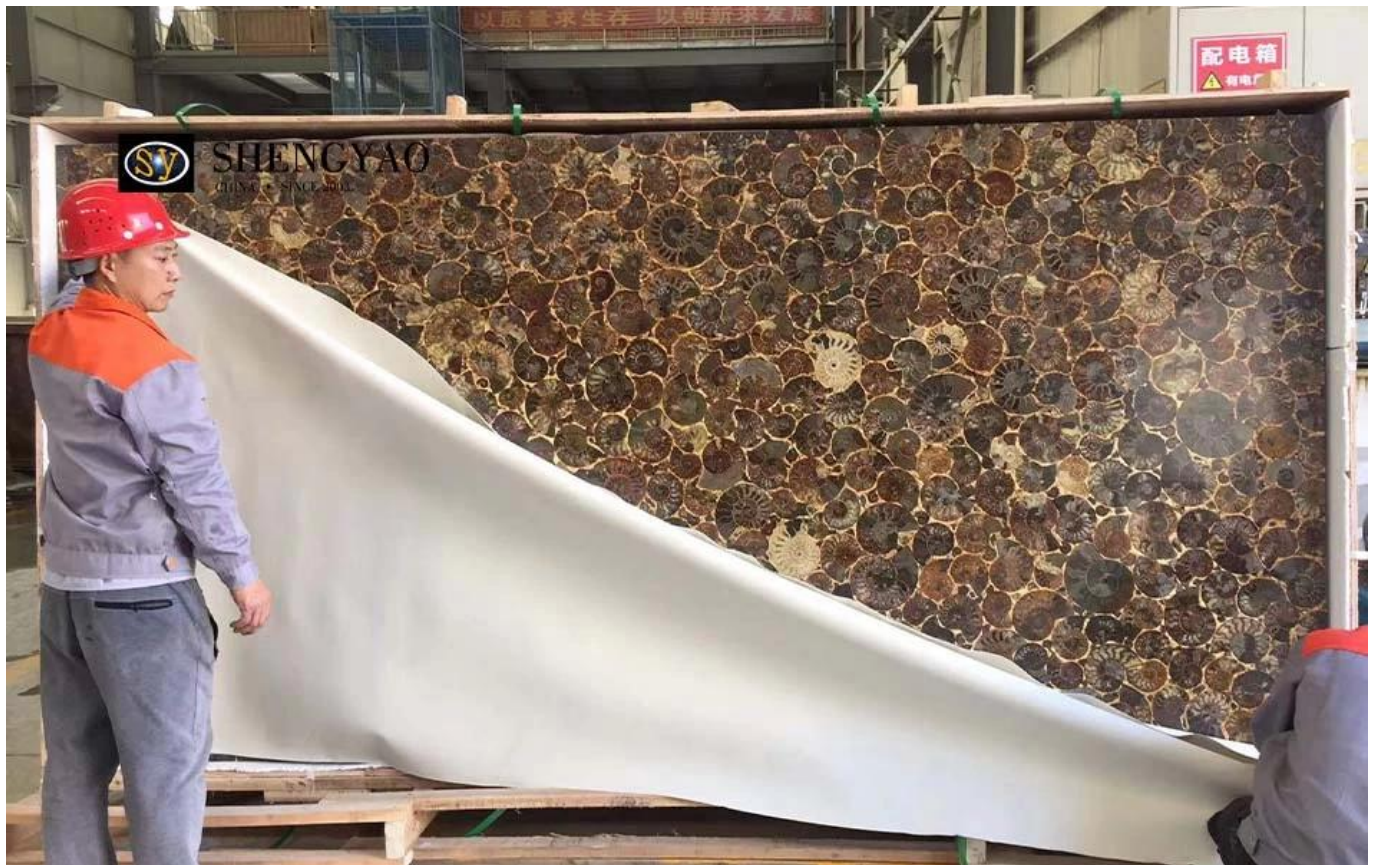
(produttore di lastre di pietre preziose Cina)

Abbiamo la flessibilità di gestire lastre di pietre semipreziose. Aumentare l'uso di pietre semipreziose con altri materiali laminati, ad esempio vetro, alluminio a nido d'ape, granito, pietra artificiale, piastrelle di ceramica e altri materiali.