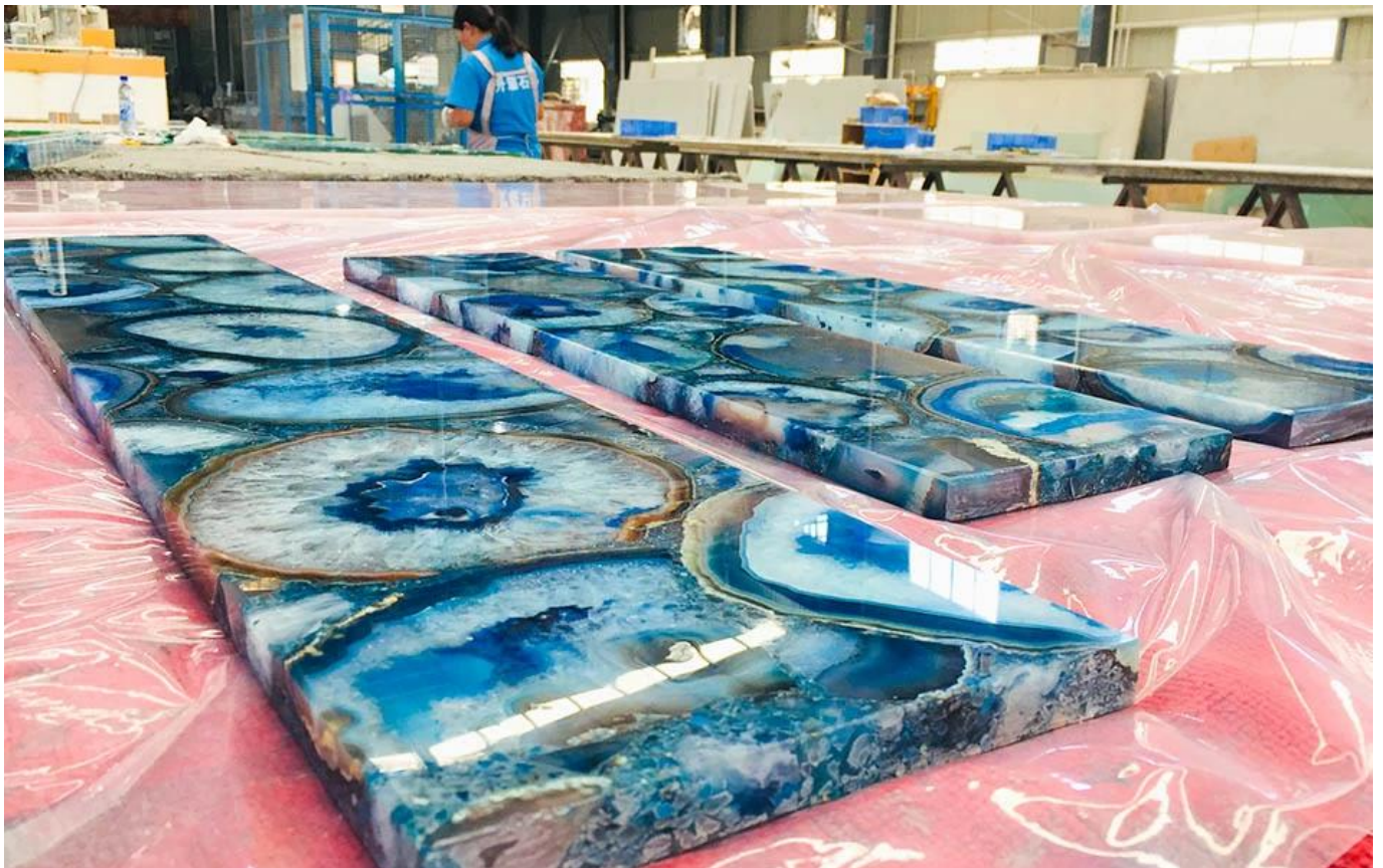
□Prezzo di fabbrica del piano di lavoro in agata blu□