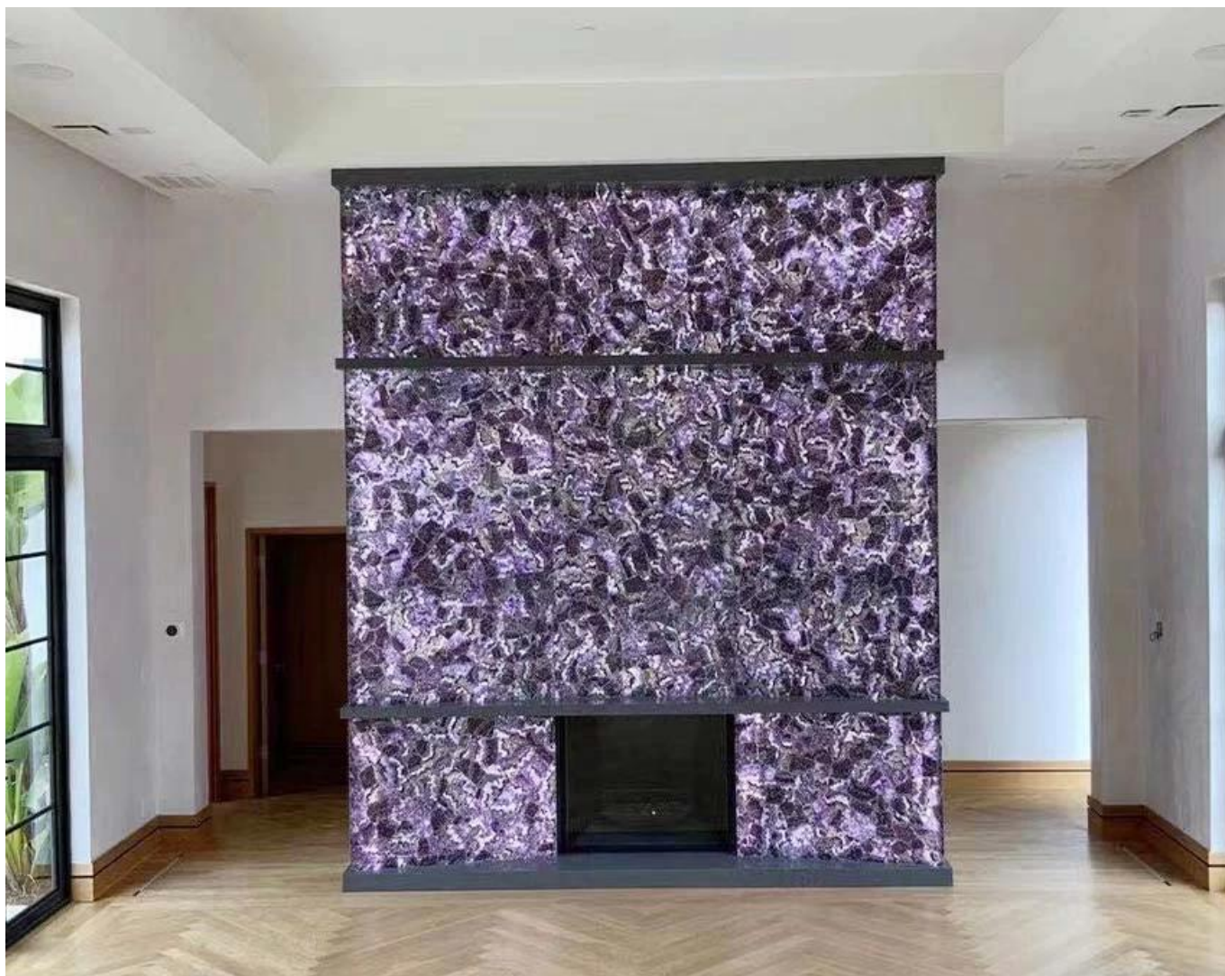
(Laje ametista é usada em lareiras)

Shenyao Gemstone é um fabricante líder e fornecedor da melhor qualidade semi preciosa laje de pedra na China. Há dezenas de Pedras semi-preciosas laje atacado .