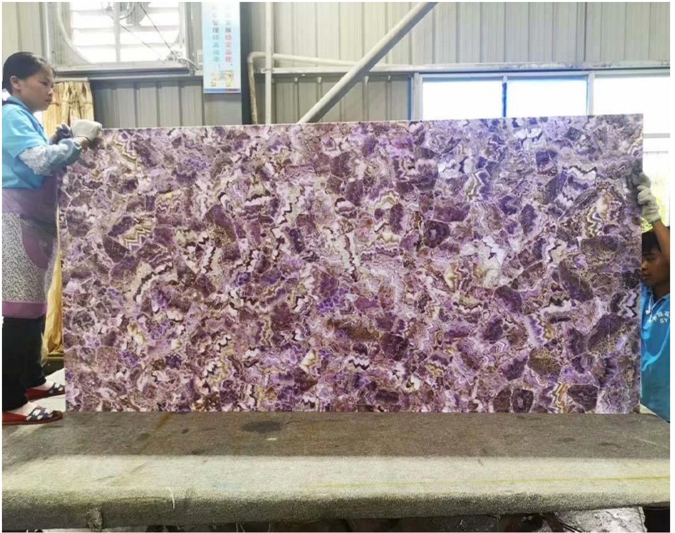
(Laje ametista backlit)

Ampla gama de cenários de aplicação para laje ametista, por exemplo, ametista gemstone laje de quartzo . é usado em cenas, como paredes de fundo, pias, bancadas de móveis, pisos, etc.