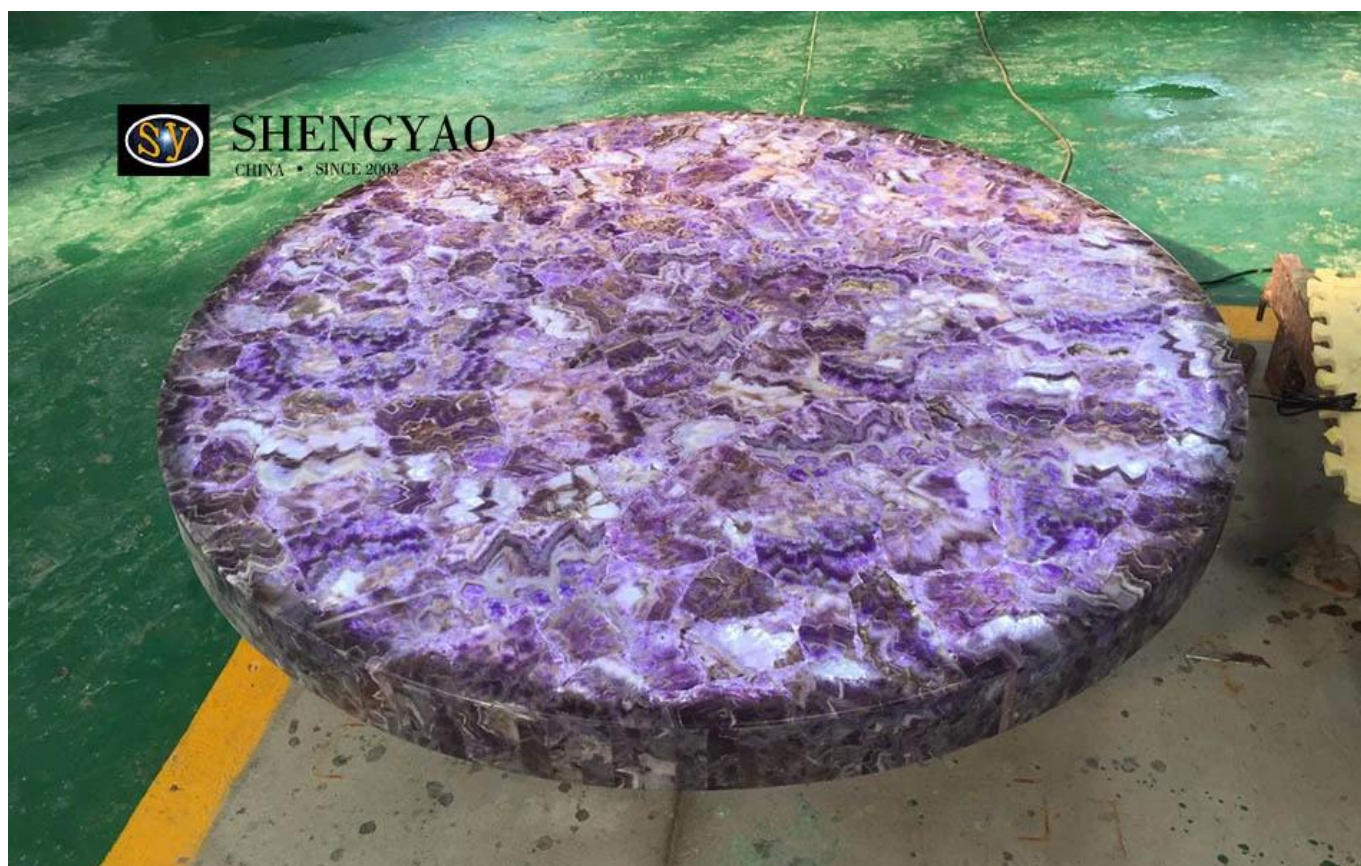
Vendo bancada de ametista retroiluminada

A ametista é uma bela pedra semipreciosa, pode ser transformada em bancadas de móveis exclusivas e retroiluminada..