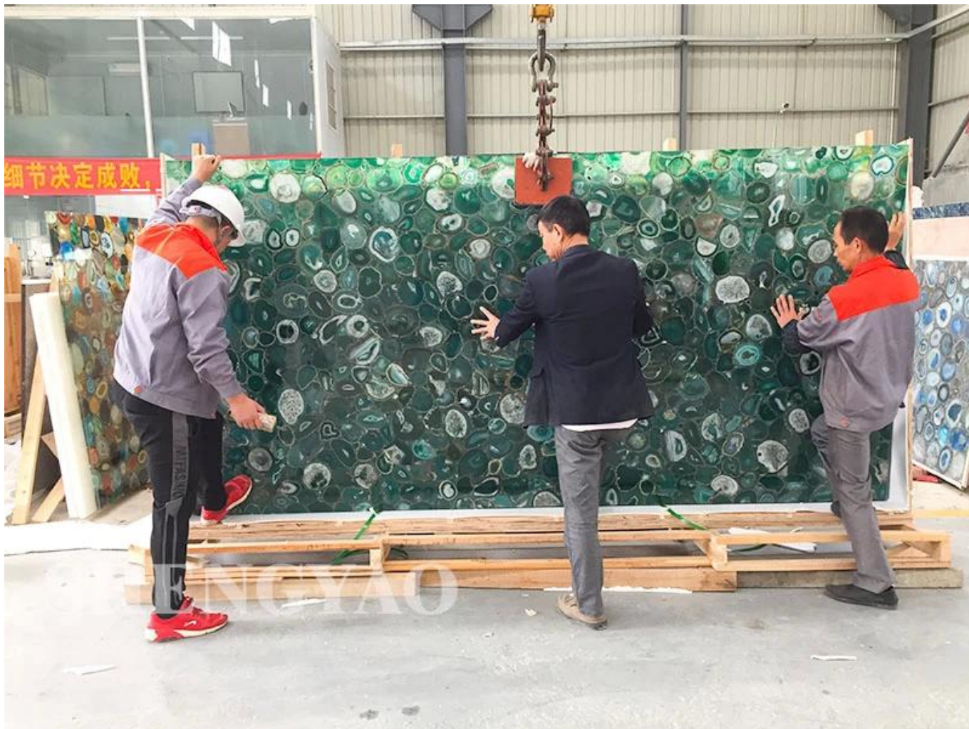
☐Embalagem em placa de ágata verde☐

Shengyao Gemstone é um fabricante e fornecedor líder de lajes de pedras semipreciosas na China. Somos uma fábrica de lajes de pedras preciosas de qualidade e .