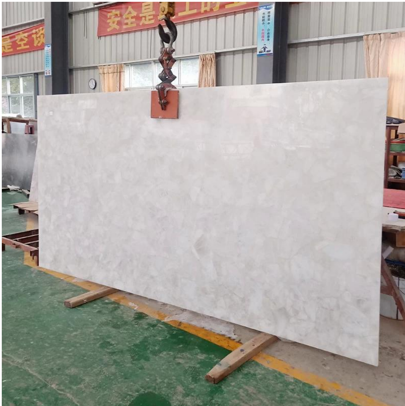
(laje de cristal branca)

Shenyao Gemstone produzido pela laje de cristal pode ser usado em muitos lugares, como casa, hotel, clube, villa e outros lugares, a aplicação do lugar também é muito, parede de fundo, piso, móveis, bancada e outros lugares.