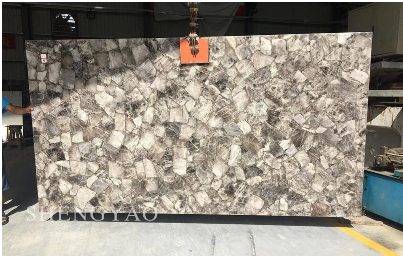
(Дымчатая хрустальная плита)

Дымчатый кристалл (также известный как дымчатый кварц, цитрин или чайный кристалл) представляет собой класс цвета: дымчато-серый дымчато-желтый, коричневый, коричневый кристаллические разновидности, эфирное размытие цвета, красота, это один из самых привлекательных членов семейства кристаллов. заснеженные Альпы, несущие в себе самые нетронутые сокровища мира, на высоте 2178 метров в окружающей скале, и похоронены завораживающие цвета драгоценного камня - дымчатый кварц (происхождение: Южная Африка, Бразилия) (с подсветкой)