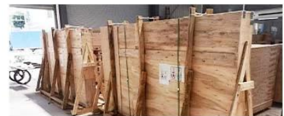
⑨ Packing & Delivery

packing in plywood case vertically and put supporting subjects inside the case