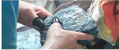
② Cutting Material

shengyao team select raw material from the origin to ensure the best quality and price.