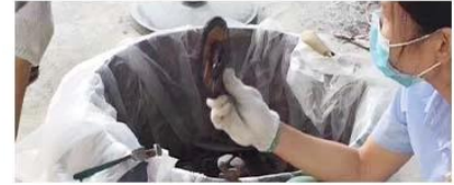
③ Separating And Inspection

cutting according to the natural texture of the stone