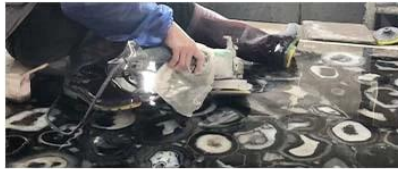
⑤ Grinding And Polishing

gap filling raw material gravel, raw materials accounted for more than 96%