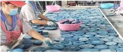
④ Splicing With Glue & Resin

European standard, according to materials, size, thickness.