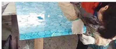
⑧ Inspection Of Finished Product

precise cutting and plain sides are following international standard.