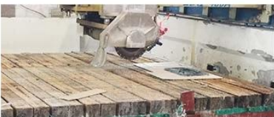
⑦ Trimming/Front Edges/Bevelling

higher standard for glossiness on stone surface, only made by qualified workers and professional machines.