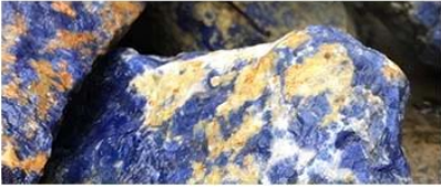
① Raw Material

shengyao team select raw material from the origin to ensure the best quality and price.