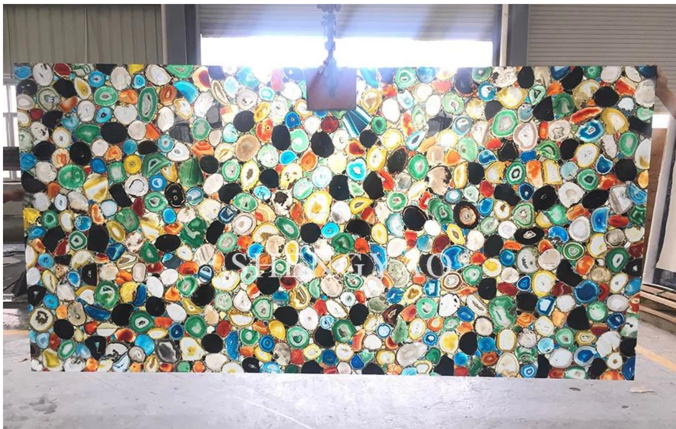
(Плита из смеси агата с подсветкой)

Мы являемся профессиональным производителем плит из полудрагоценных камней / драгоценных камней в Китае. У нас есть возможность обрабатывать плиты из полудрагоценных камней. Увеличить использование полудрагоценных камней за счет ламинирования других материалов, например, стекла, алюминиевых сот, гранита, искусственных материалов. камень, керамическая плитка и другие материалы.