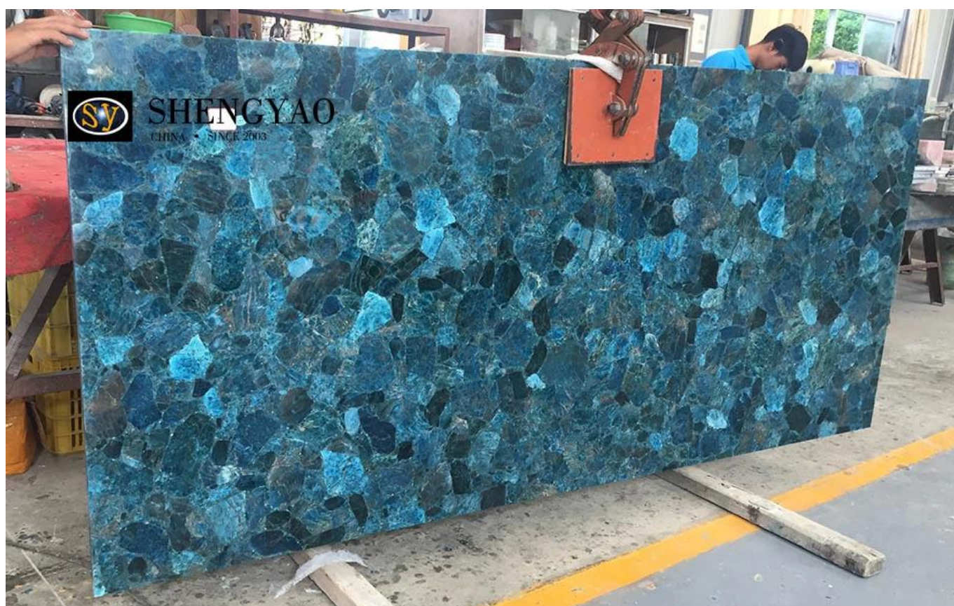
□Nhà cung cấp tấm đá bán quý màu xanh Trung Quốc□

Apatit dùng để chỉ quặng photphat trong đá mácma và đá biến chất ở dạng apatit tinh thể, một nhóm các khoáng chất photphat có chứa canxi. Apatit có dạng tinh thể thủy tinh thể, khối hoặc nốt sần, với nhiều màu sắc khác nhau, chủ yếu là các cột hình lục giác với bề mặt hình nón. Các mỏ apatit lớn chủ yếu là đá trầm tích biển nông, chủ yếu là collophanit, như Xiangyang ở Hồ Bắc, Kunyang ở Vân Nam và Kaiyang ở Quý Châu. (Ngược sáng)