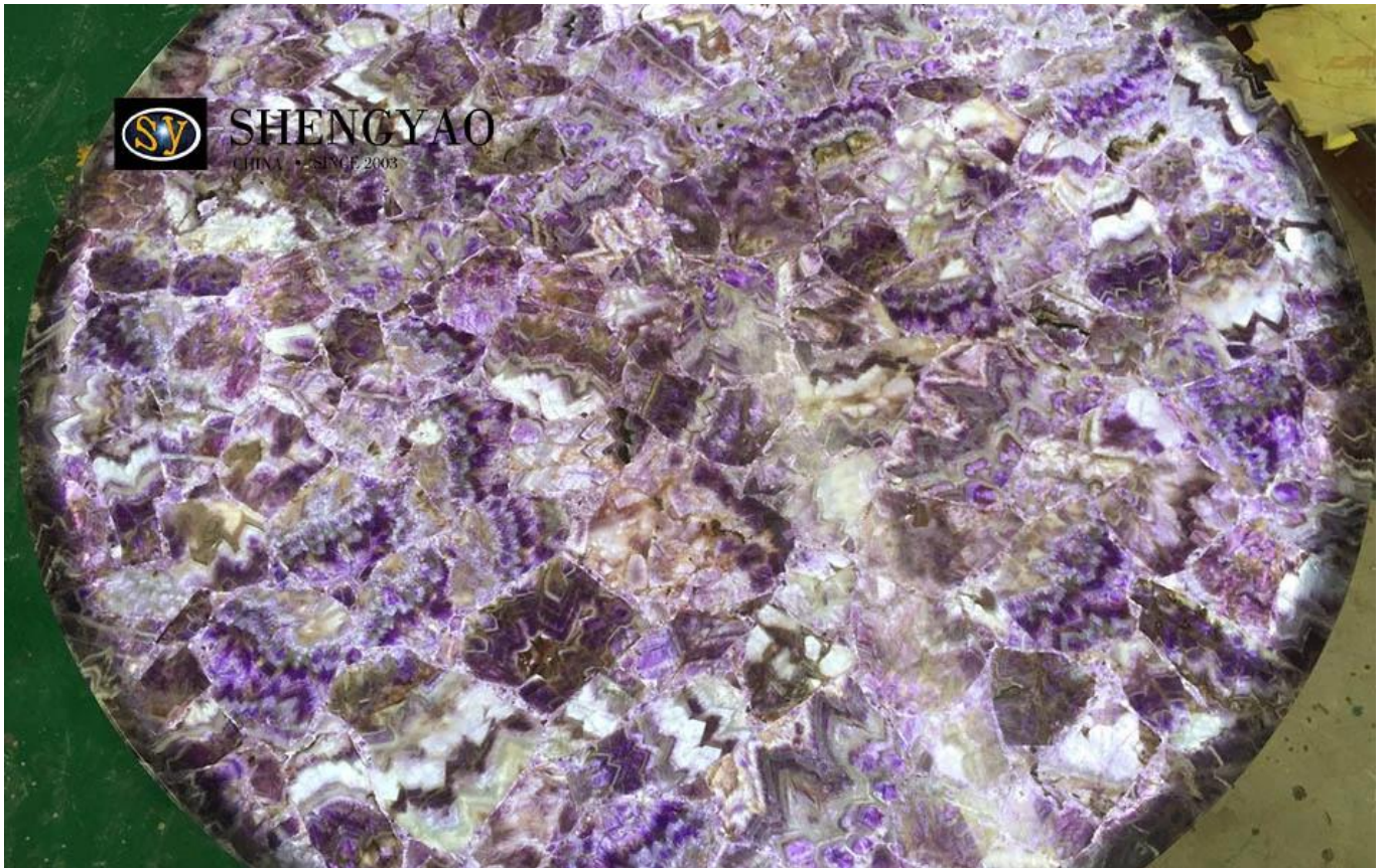
□ bán buôn đá quý backlit □

Thành phần chính của thạch anh tím là silicon dioxide, độ cứng 7, trọng lượng riêng 2,65, chiết suất 1,54-1,55, có lưỡng sắc. Khi nhìn từ các góc độ khác nhau, nó có thể hiển thị tông màu tím xanh hoặc đỏ và thường được tạo thành một bề mặt hỗn hợp hoặc dạng bậc. Thạch anh tím sản xuất tự nhiên có chứa các khoáng chất như sắt, mangan và tạo thành màu tím rất đẹp, màu chính có các màu như hoa cà, amaranthine, đỏ thẫm, đỏ tươi, tím đậm, tím xanh, tối ưu với amaranthine sẫm và đỏ tươi, quá yếu màu tím tương đối phổ biến. Thạch anh tím tự nhiên thường có các vết nứt băng tự nhiên hoặc các tạp chất mây trắng. Thạch anh tím với giá trị đá quý được tìm thấy trong đá núi lửa, đá pegmatit, hoặc đá vôi, đá phiến sét trong hang động. Thạch anh tím phân bố nhiều trong tự nhiên, được sản xuất chủ yếu ở Brazil, Nga, Nam Phi, Madagascar.