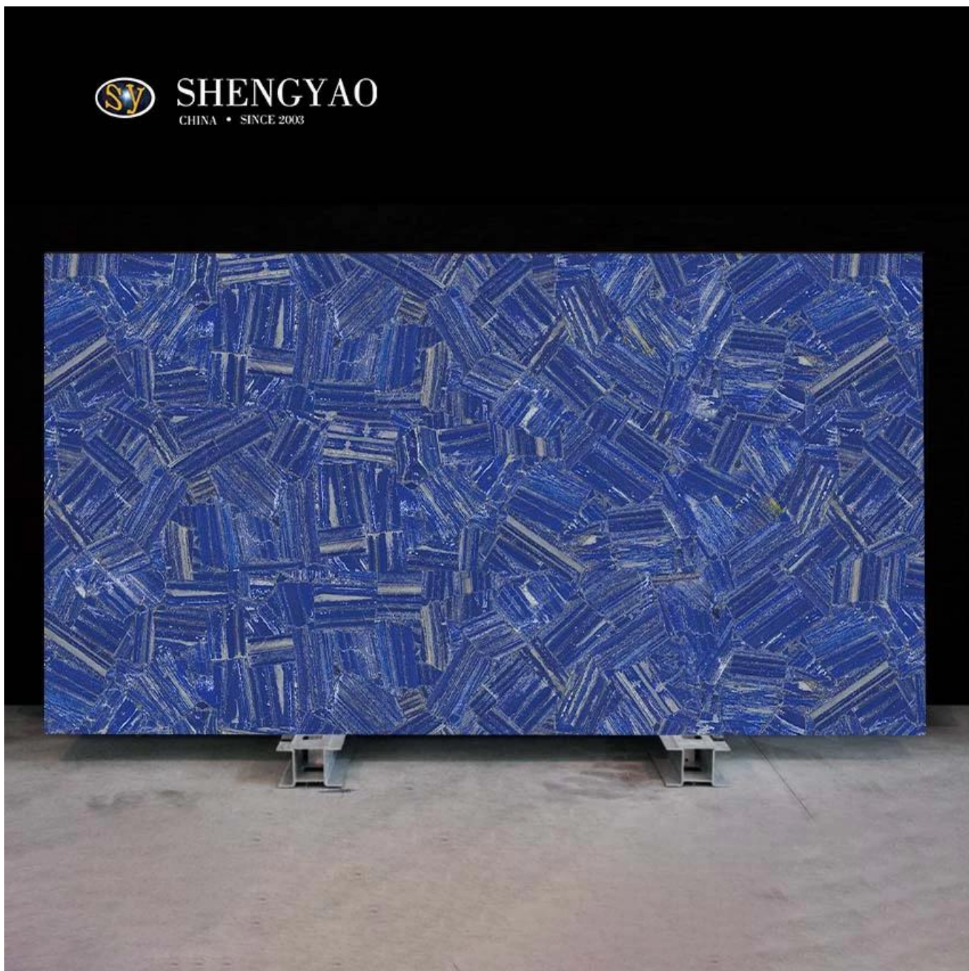
(Lapis lazuli Gemstone slab)