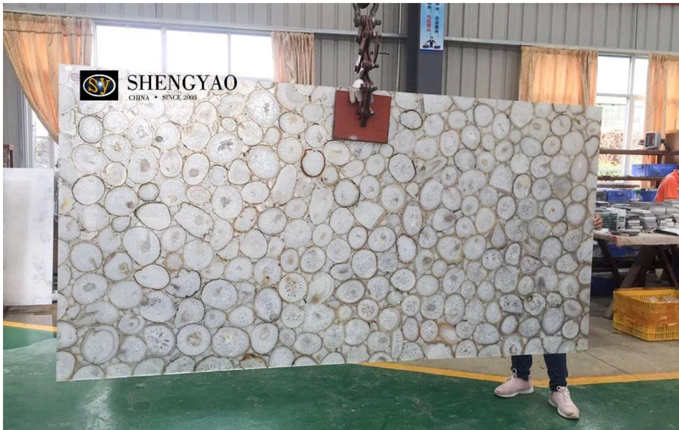
[tấm mã não trắng giảm giá]

Chúng tôi có thể linh hoạt trong việc xử lý phiến đá bán quý. tấm thành huy chương tia nước, tường nghệ thuật, đồ nội thất, mặt bàn, bồn rửa và các sản phẩm khác.