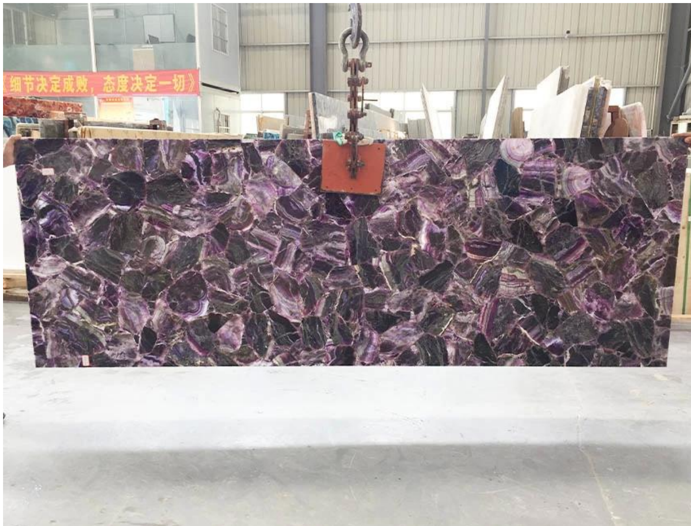
(Tấm sọc Fluorite tím)

Đá quý Shengyao là nhà sản xuất và cung cấp hàng đầu các tấm đá bán quý chất lượng tốt nhất tại Trung Quốc. Chúng tôi có thể linh hoạt để xử lý tấm đá bán quý. Tăng cường sử dụng đá bán quý bằng nhiều lớp vật liệu khác, ví dụ, thủy tinh, nhôm tổ ong, đá granit, đá nhân tạo, ngói gốm và các vật liệu khác. Chúng tôi cũng có thể xử lý tấm đá bán quý vào tường nghệ thuật, đồ nội thất, mặt bàn, bồn rửa và các sản phẩm khác.